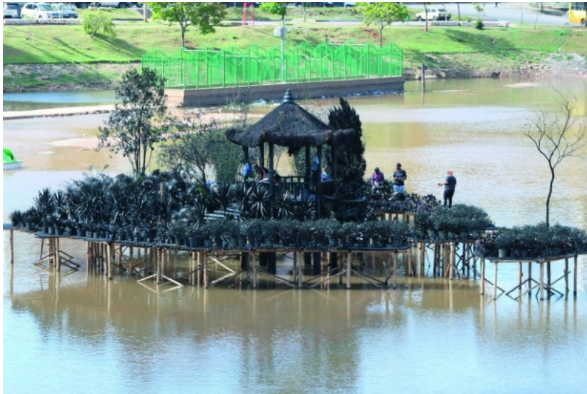
Ilha do Encantamento. Obra idealizada pela chinesa Jennifer Wen Ma é uma alusão aos problemas e pressões da vida contemporânea